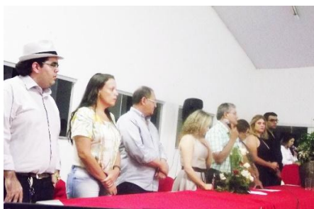
Composição da mesa que instaurou a abertura da “FASUG de mãos dadas com o conhecimento e com a valorização da vida” – 20.10.2014

“FASUG DE MÃOS COM O CONHECIMENTO E COM A VALORIZAÇÃO DA VIDA”